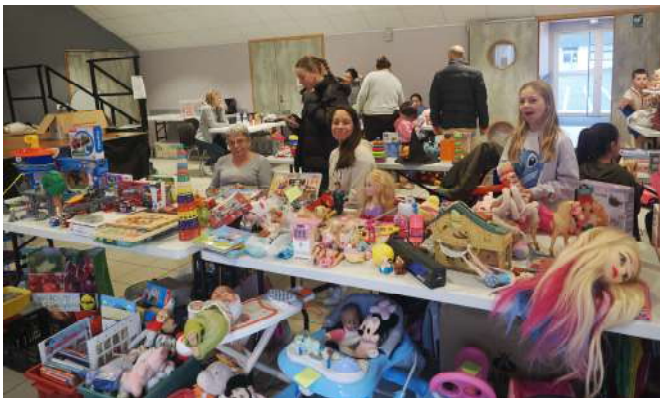
Ci-dessous la bourse aux jouets du 17 novembre et le cinéma de Noël du 14 décembre