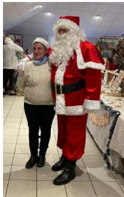
Ci-contre et ci-dessous : le marché de Noël du dimanche 8 décembre organisé par le Comité des fêtes