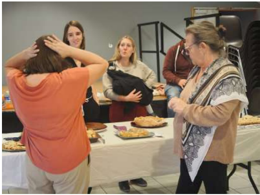
Ci-contre : le marché aux fleurs du 27 octobre et le troc vêtements du 2 novembre